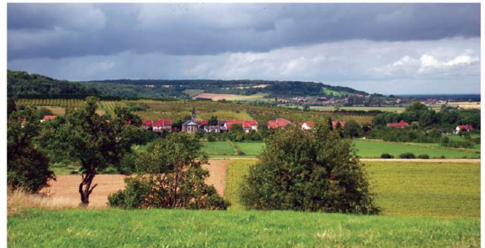
Paysage en chemin.

FFRandonnée les chemins, une vieillesse est-ce que www.ffrandonnee.fr