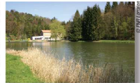
Étang du Longeau.

3 Prendre à droite un chemin creux qui serpente en descendant au fond d'un petit vallon jusqu'aux étangs du Longeau. Au bord de l'eau, tourner à gauche vers la guinguette. Contourner l'étang, revenir par la digue, puis aller à gauche. Poursuivre sur le chemin en fond de vallon jusqu'à la route de Dommartin-la-Montagne à Hannonville-sous-les-Côtes. Emprunter la route à droite, franchir sur un pont le ruisseau du Longeau. Poursuivre sur environ 900 m et, à hauteur d'un virage sur la droite, attendre un départ de chemin sur la gauche.