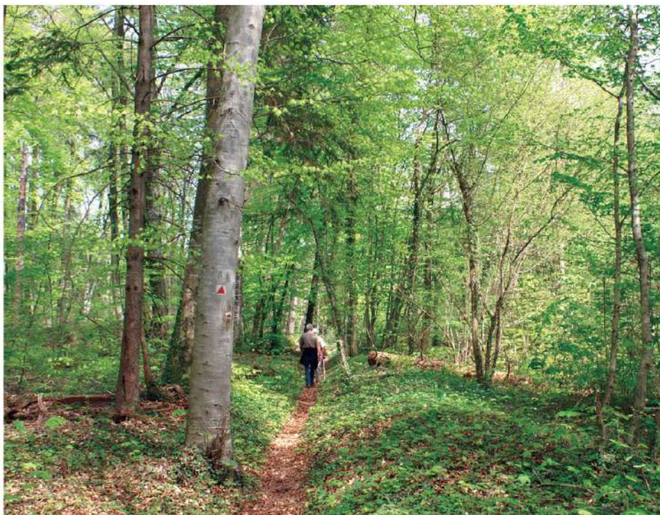
Dans le bois d'Hannonville.

Rejoignez-nous et randonnez l'esprit libre