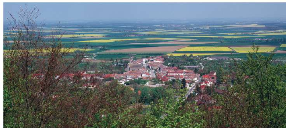
Vue sur Hannonville-sous-les-Côtes.