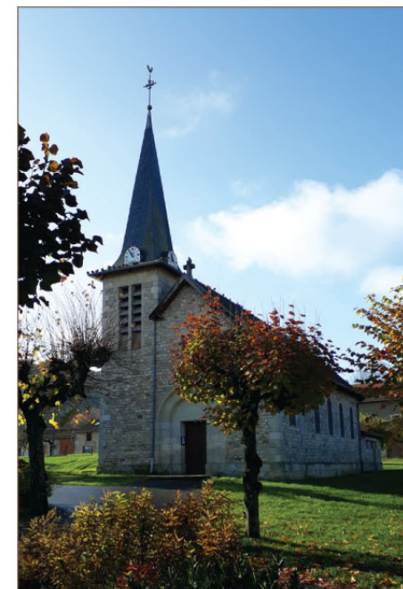
Église Saint-Étienne de Combres-sous-les-Côtes

6 En arrivant, se diriger à gauche [👁 > église Saint-Vanne], longer par la droite la place des Platanes [👁 > calvaire]. Sur la droite, franchir un petit ruisseau et retrouver le point de départ.