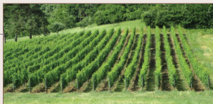
Une parcelle de vigne du domaine de Muzy

E nracinée en Meuse depuis l'époque gallo-romaine, la culture de la vigne sera développée au fil des siècles par les moines (et hommes d'église) et connaîtra son apogée au cours du XIX e siècle. Le département sera alors parmi les plus viticoles de France avec 13 700 hectares. Après avoir été décimé par les guerres et le phylloxera, le vignoble des Côtes de Meuse renaît dans les années 1970. Un sol argilo-calcaire, un micro-climat, une variété de terroirs, de belles expositions en pente douce (sud, sud-est) font des Côtes de Meuse un écrin pour la vigne.