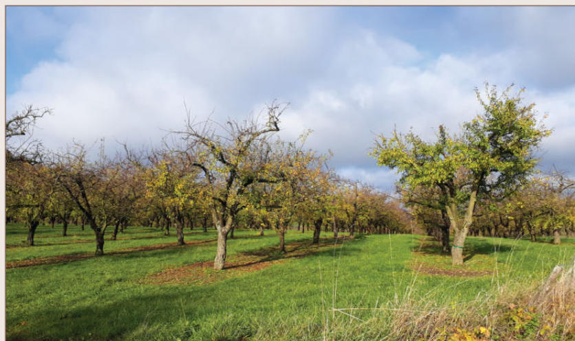
Un verger de mirabelliers, à Herbeuville